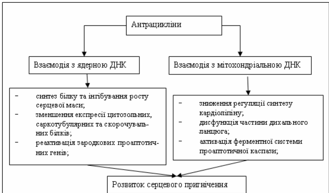
Рис. 2. Патогенетичні механізми антрациклінової кардіоміопатії

Втручання антрациклінів в ядерну ДНК може інгібувати синтез білка, зростання серцевих тканин і викликати зниження регуляції скоротливих білків, саркоплазматичного ретикулуму та цитозольних білків. Крім того, ці перешкоди можна визначити повторною експресією генів, які активні під час ембріонального періоду розвитку плоду, коли вони кодують синтез як профакторів апоптозу, так і ферментативних і функціонально незрілих м'язових білків. З іншого боку, втручання в мітохондріальну ДНК в основному зачіпає функцію мітохондріального дихального ланцюга, якому може бути завдано серйозної шкоди шляхом інгібування кардіоліп-